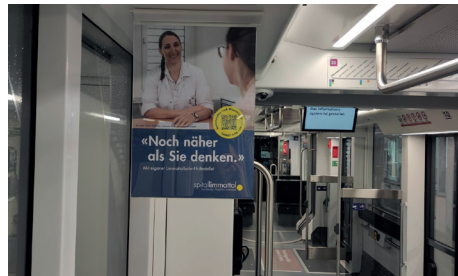
Hängekarton Tramlink (LTB)