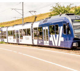
ABe 4/8 Diamant, BDB

oder wir Sie persönlich und erstellen Ihnen eine massgeschneiderte öV-Werbekampagne auf dem Liniennetz von Aargau Verkehr.