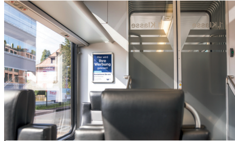
RailPosterMidi Zug (WSB und BDB)