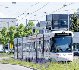
Be 6/8 Tralink, Limmattal Bahn