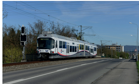
ABe 4/8 (WSB)