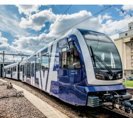
ABe 4/12 Saphir, WSB